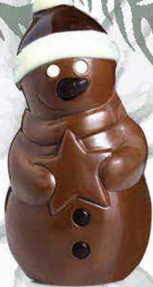
Réf. 210 Lait 210N Noir 210B Blanc 16 cm - 130g