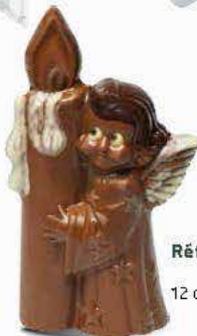
Réf. 205 Lait 205N Noir 12 cm - 60g