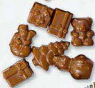
Réf. 215 Lait 215N Noir 215B Blanc