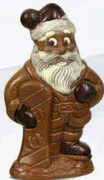
Réf. 204 Lait 204N Noir 16 cm - 150g