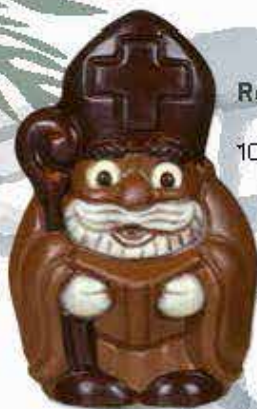
Réf. 209 Lait 209N Noir 10 cm - 50g