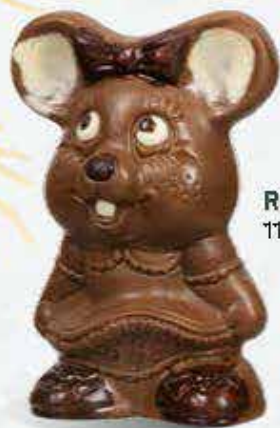
Réf. 212 11,5 cm - 100g