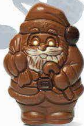
Réf. 206 Lait 206N Noir 9 cm - 50g