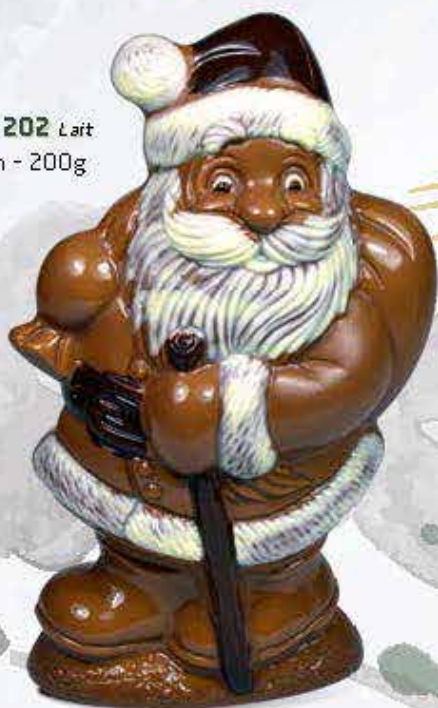
Réf. 202 Lait 21 cm - 200g