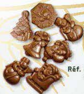
Réf. 214 Lait 214N Noir