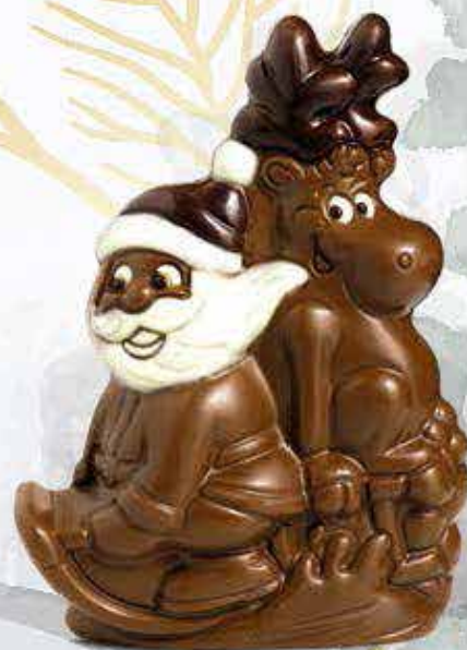
Réf. 203 Lait 203N Noir 203B Blanc 16,5 cm - 150g