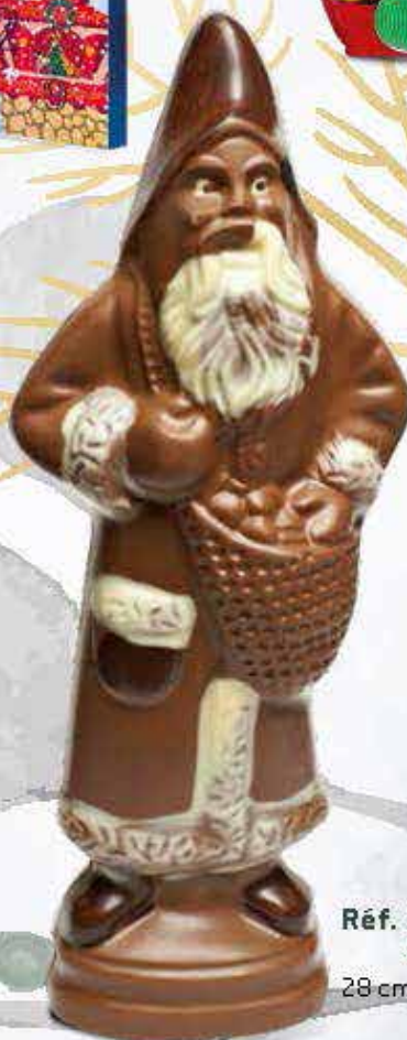
Réf. 201 Lait 201N Noir 28 cm - 250g