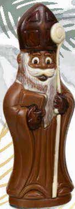
Réf. 208 Lait 208N Noir 208B Blanc 18 cm - 120g